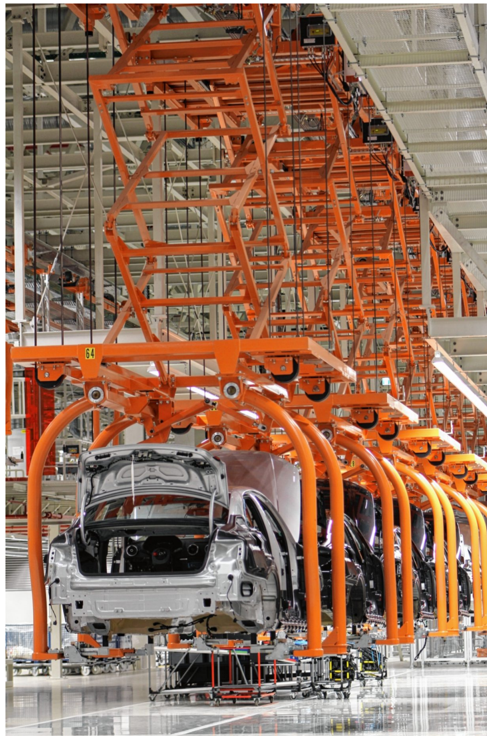
Die Rofa-Gruppe hat sich auf die Entwicklung und Produktion von Fördertechnik wie dieses in der Automobilbranche eingesetzte Schwerlast-Elektrohängebahn-Gehänge spezialisiert.